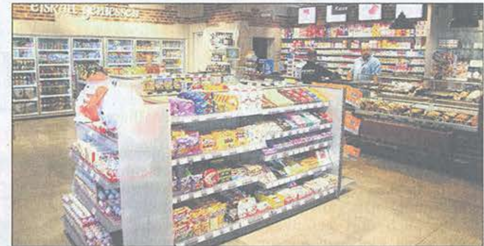
Ein breites Sortiment wird rund um die Uhr im Aral-Shop angeboten.

ther Tank GmbH zusammen mit seinem Pächter Ingo Neunast und seinen treuen und vielen neuen Kunden mit einem großen Event begehen. Los geht es am Vormittag um 10 Uhr mit dem ersten Highlight, einer großen Verlosungsaktion. So gibt es zum Beispiel einen Reisegutschein über 500 Euro oder auch 2 Eintrittskarten für die Formel 1 zu gewinnen. Lose erhalten alle Kunden des ARAL-Shops und der „blitzblank“-Waschanlage ab einem Mindestumsatz von nur einem Euro in der Zeit vom 6. bis 14. September. Für das leibliche Wohl aller Gäste ist selbstverständlich bestens gesorgt. Bei Kaffee, Kuchen und Grillspezialitäten kann es sich jeder gut gehen lassen. Besonders viel Spaß ist vorprogrammiert für alle Kinder, die sich auf der Hüpfburg, beim Trampolin-Bungee und Kinderschminken austoben können.